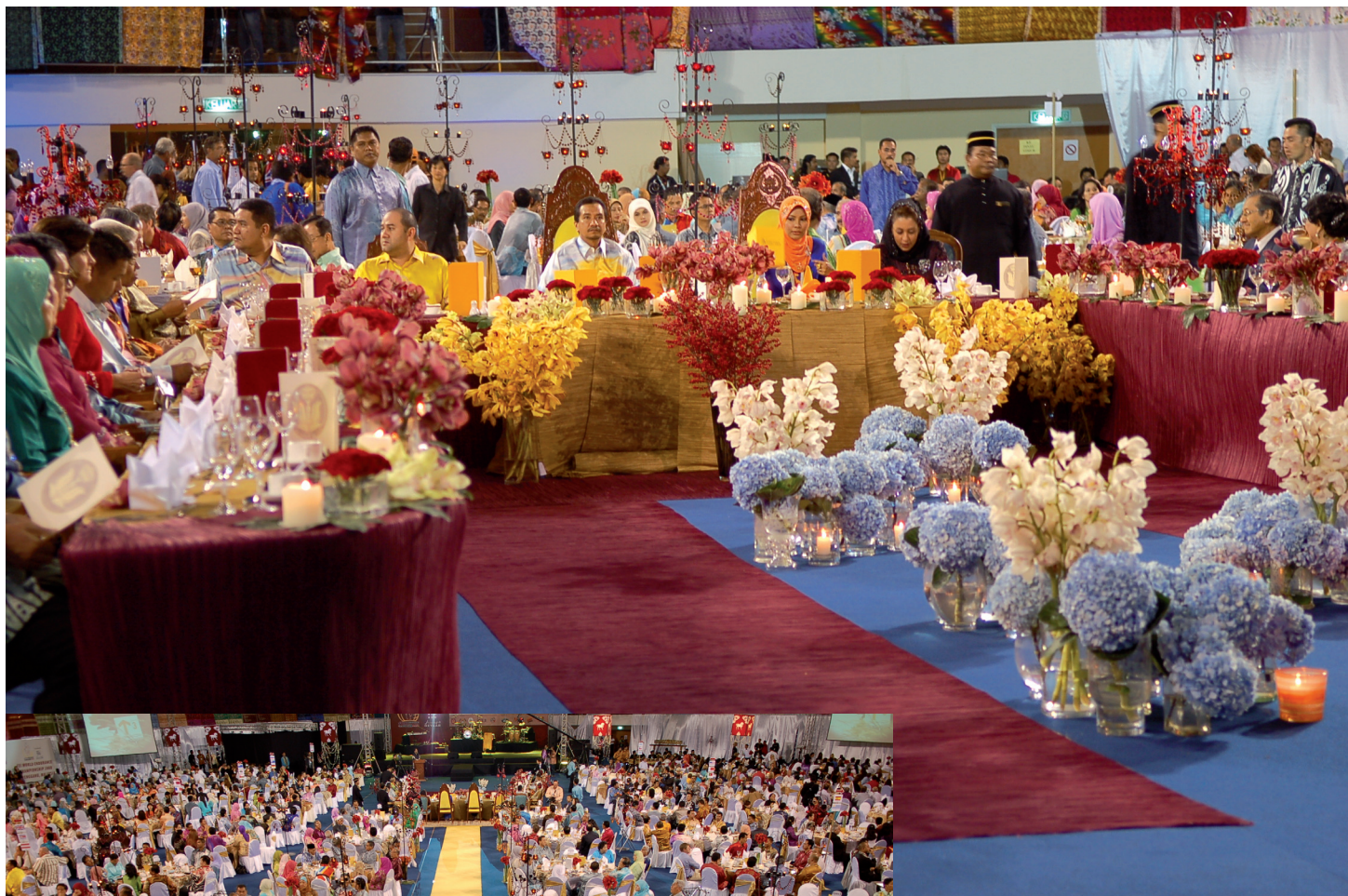
Gala Dinner: Venue: Kuala Terengganu Indoor Stadium