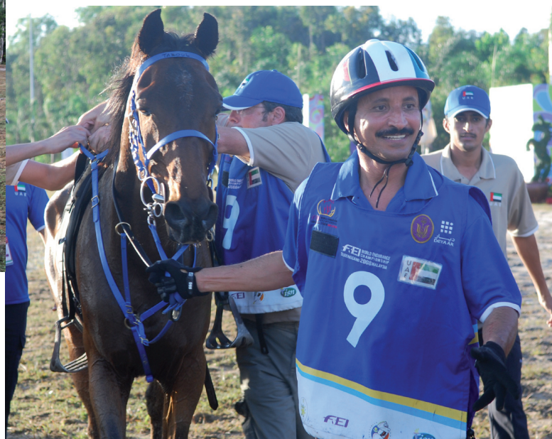
Bin Sulayem, Sultan Ahmed Sultan UAE