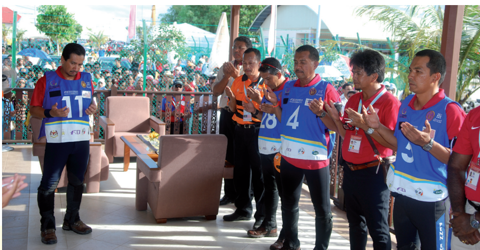
The King Zainal Abidin, SPBY Di Pertuan Agong Tuanku Mizan, praying with his riders prior to the race.