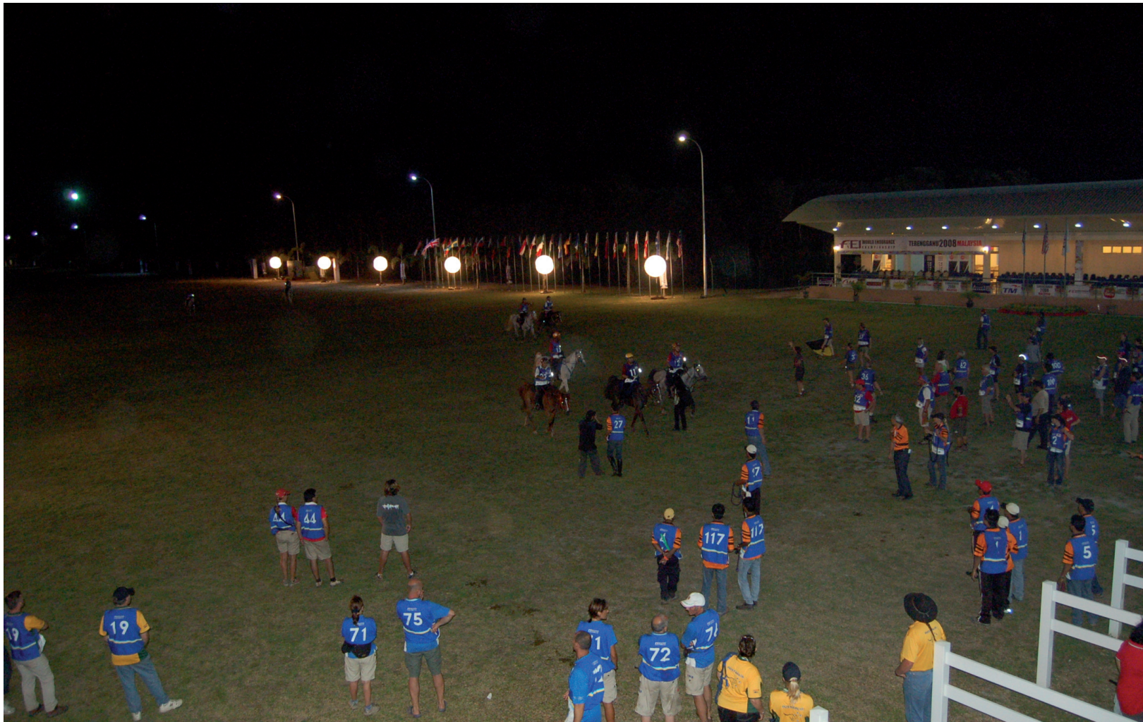
The King's arrival at the gate during the night