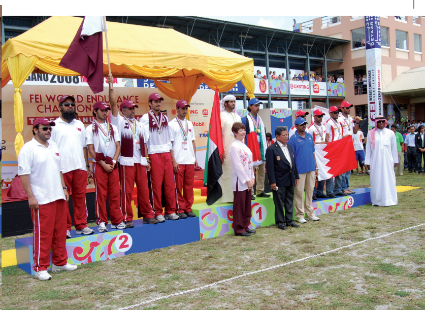
The Queen Seri Paduka Baginda Raja Permaisuri Agong Tuanku Zahirah with the winners.