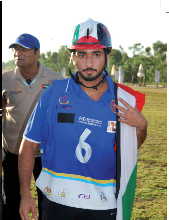
AlMaktoum, HH Sh Majid Bin Mohd UAE