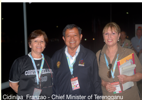
Cidiniha Franzao - Chief Minister of Terengganu Yab Dato Ahmad Said - Alessandra Durazzano