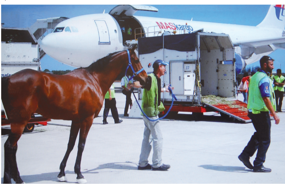
The arrival of the horses