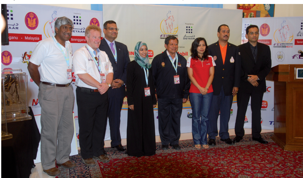
Sponsor's Press Conference