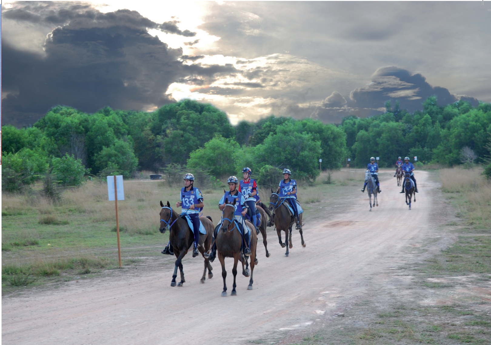
Track – First Loop