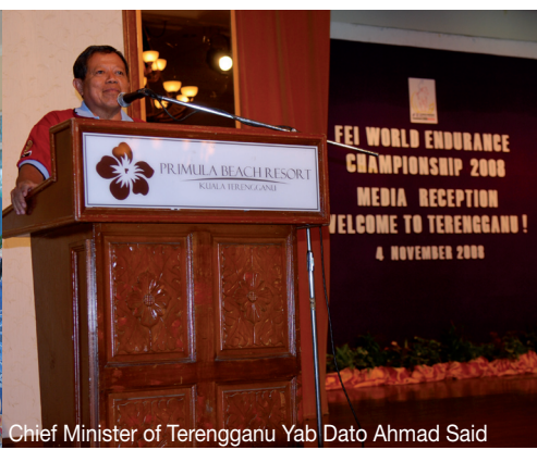
Chief Minister of Terengganu Yab Dato Ahmad Said Media Reception